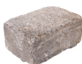
Dreiviertelstein Format 30 x 20 x 14 cm