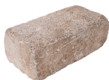
Normalstein Format 40 x 20 x 14 cm

Format 20 x 20 x 14 cm = ca. 9 Stück je m 2