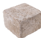
Halbstein Format 20 x 20 x 14 cm