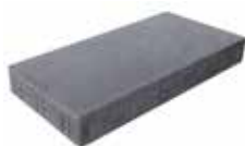
Format 60 x 30 cm

Materialbedarf je lfdm Format 15 x 30 cm = ca. 0,17 Stück bzw. 0,05 Stück je Farbe