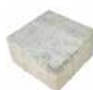
Stein 2 16,5 x 16,5 cm