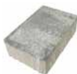
24,7 x 16,5 cm

Format 16,5 x 12,3 cm = ca. 15 Stück je m 2