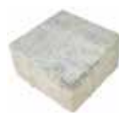
Stein 1 16,5 x 16,5 cm

Format 16,5 x 16,5 cm = ca. 20,6 Stück je m² Format 16,5 x 12,3 cm = ca. 20,6 Stück je m²