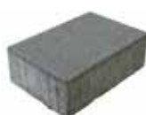
Stein 1 24,7 x 16,5 cm

Format 24,7 x 16,5 cm = ca. 18 Stück je m 2 Format 16,5 x 16,5 cm = ca. 9 Stück je m 2