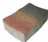
Format 25 x 16,5 cm

Format 25 x 16,5 cm = ca. 18 Stück je m 2 Format 16,5 x 16,5 cm = ca. 9 Stück je m 2