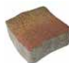
Format 16,5 x 16,5 cm