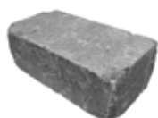
Format 40 x 20 x 14 cm

Materialbedarf je m 2 Format 40 x 20 x 14 cm = ca. 4,9 Stück Format 30 x 20 x 14 cm = ca. 7,1 Stück Format 30 x 20 x 7 cm = ca. 11,9 Stück Format 20 x 20 x 7 cm = ca. 13 Stück