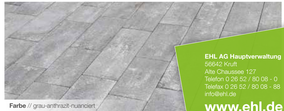
Farbe // grau-anthrazit- nuanciert

Verlegebeispiele zum jeweiligen Produkt finden Sie auf www.ehl.de