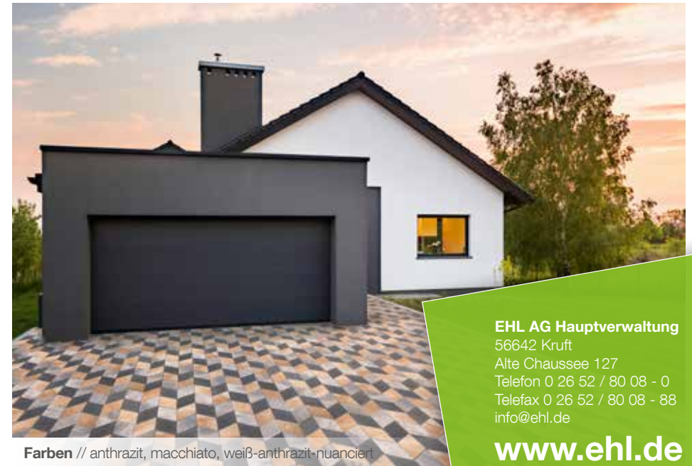
Farben // anthrazit, macchiato, weiß-anthrazit-nuanciert

Verlegebeispiele zum jeweiligen Produkt finden Sie auf www.ehl.de