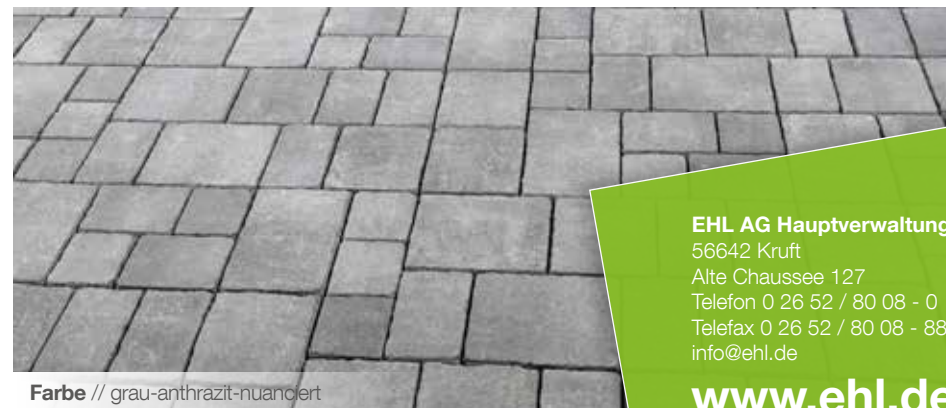
Farbe // grau-anthrazit-nuanciert

Verlegebeispiele zum jeweiligen Produkt finden Sie auf www.ehl.de