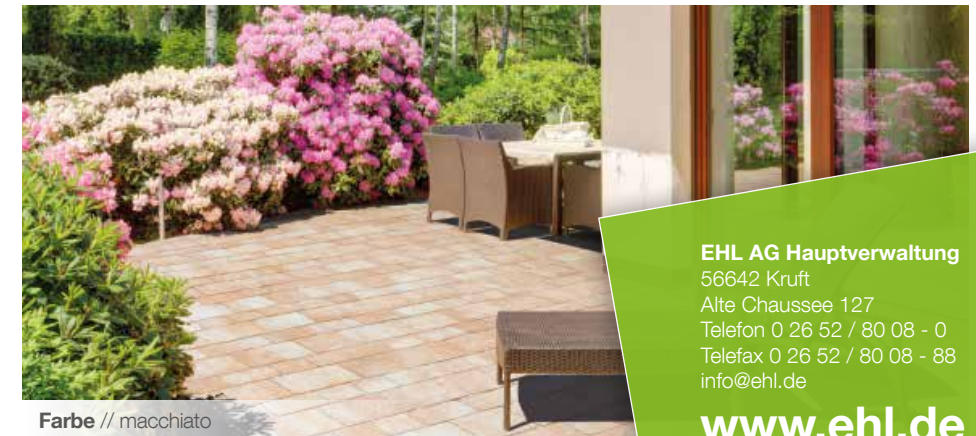
Farbe // macchiato

Verlegebeispiele zum jeweiligen Produkt finden Sie auf www.ehl.de