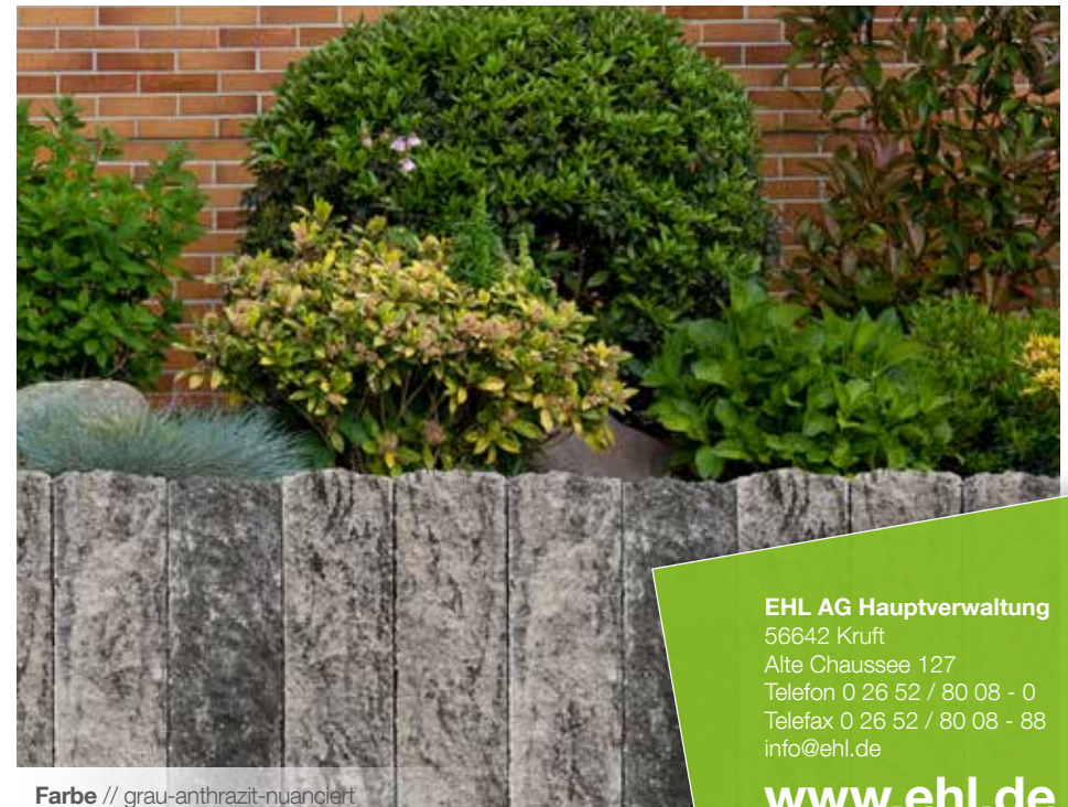
Farbe // grau-anthrazit-nuanciert

EHL AG Hauptverwaltung 56642 Kruft Alte Chaussee 127 Telefon 0 26 52 / 80 08 - 0 Telefax 0 26 52 / 80 08 - 88 info@ehl.de