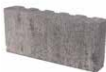
Format 40,2 x 18 x 6,7 cm