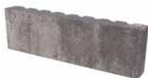
Format 60,3 x 18 x 6,7 cm

Format 60,3 x 18 cm = ca. 5,53 Stück je m 2 Format 40,2 x 18 cm = ca. 5,53 Stück je m 2