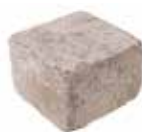
Halbstein Format 20 x 20 x 14 cm