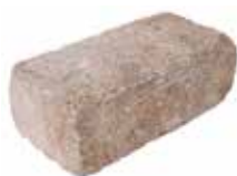
Normalstein Format 40 x 20 x 14 cm

Format 20 x 20 x 14 cm = ca. 9 Stück je m 2