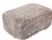
Dreiviertelstein Format 30 x 20 x 14 cm