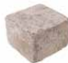
Halbstein Format 20 x 20 x 14 cm