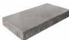
Stein 1 60 x 30 cm

Format 30 x 15 cm = ca. 8,19 Stück je m 2