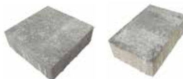
Format 24,7 x 24,7 cm

Format 24,7 x 16,5 cm = ca. 9,9 Stück je m 2