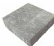
Format 24,7 x 24,7 cm

Format 24,7 x 16,5 cm = ca. 14,1 Stück je m 2