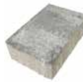
Format 24,7 x 16,5 cm