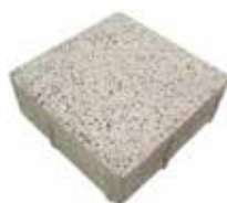
Format 20 x 20 cm

Format 20 x 20 cm = ca. 11 Stück je m 2 Format 20 x 10 cm = ca. 27,7 Stück je m 2