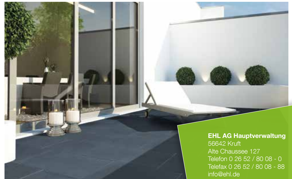
Farbe // anthrazit

Verlegebeispiele zum jeweiligen Produkt finden Sie auf www.ehl.de