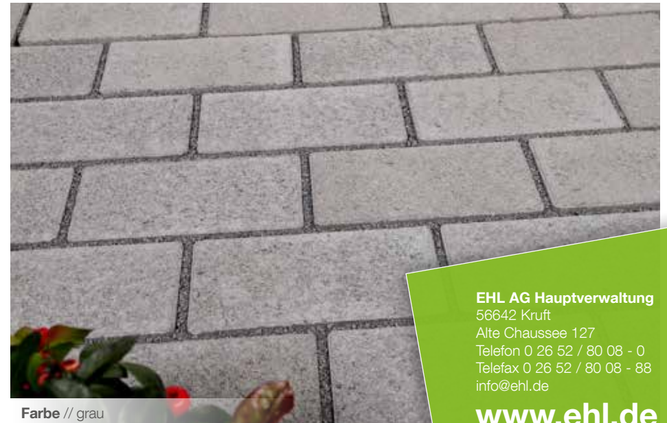
Farbe // grau

Verlegebeispiele zum jeweiligen Produkt finden Sie auf www.ehl.de