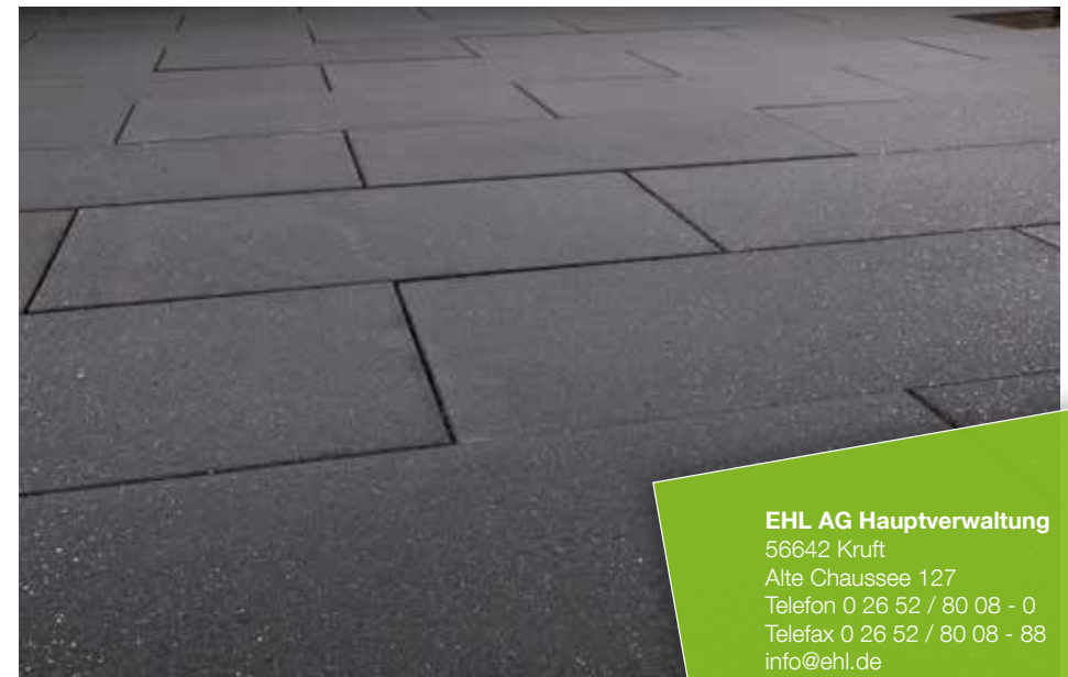
Farbe // anthrazit

Verlegebeispiele zum jeweiligen Produkt finden Sie auf www.ehl.de