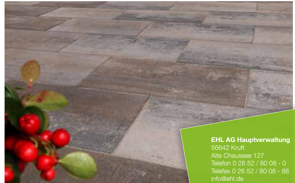
Farbe // muschelkalk

Verlegebeispiele zum jeweiligen Produkt finden Sie auf www.ehl.de