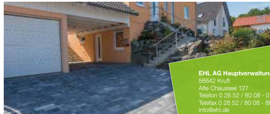
Farbe // weiß-anthrazit-nuanciert

Verlegebeispiele zum jeweiligen Produkt finden Sie auf www.ehl.de