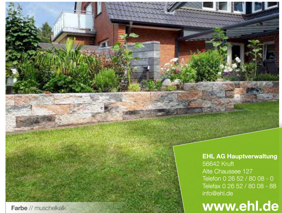
Farbe // muschelkalk

EHL AG Hauptverwaltung 56642 Kruft Alte Chaussee 127 Telefon 0 26 52 / 80 08 - 0 Telefax 0 26 52 / 80 08 - 88 info@ehl.de