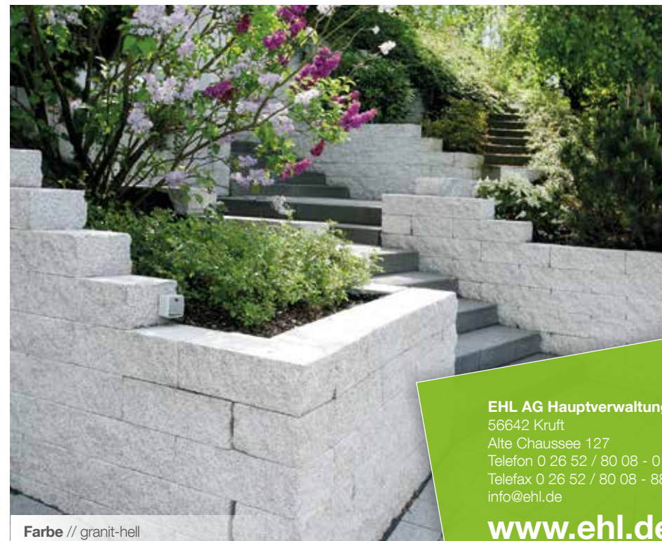
Farbe // granit-hell

EHL AG Hauptverwaltung 56642 Kruft Alte Chaussee 127 Telefon 0 26 52 / 80 08 - 0 Telefax 0 26 52 / 80 08 - 88 info@ehl.de