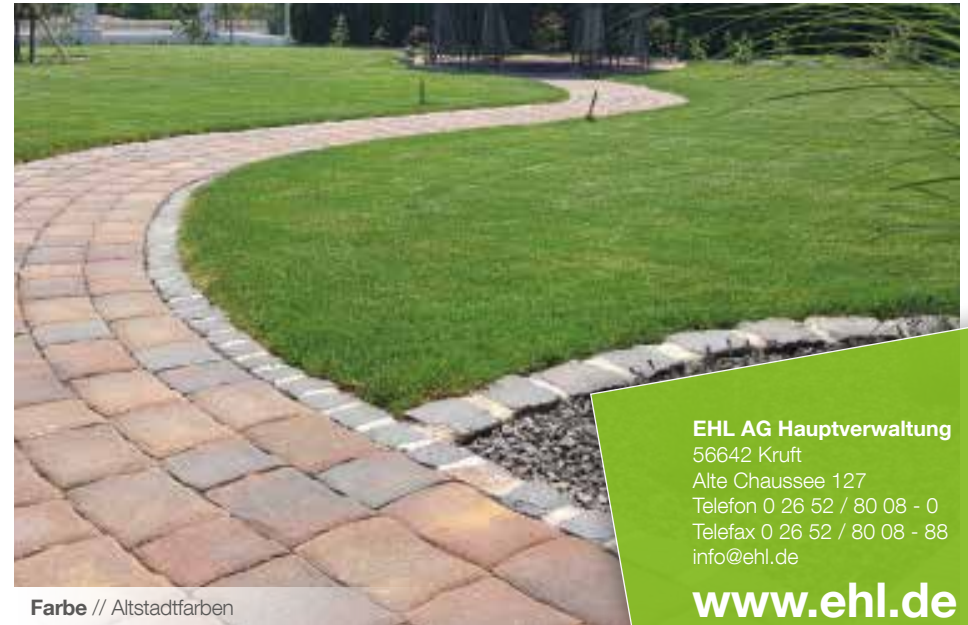
Farbe // Altstadtfarben

Verlegebeispiele zum jeweiligen Produkt finden Sie auf www.ehl.de